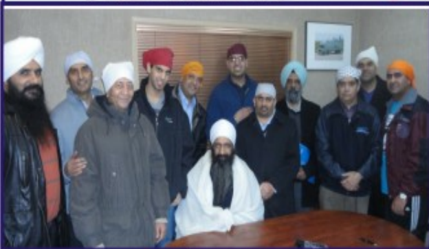
ਸੈਮ ਟਰਾਂਸਪੋਰਟ ਕੰਪਨੀ ਕੈਨੇਡਾ ਪ੍ਰੇਮੀ ਸਮੇਤ ਬਾਬਾ ਜੀ।