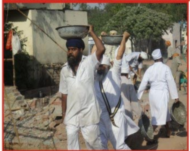
ਰਤਵਾੜਾ ਦੀ ਬਰਾਂਚ ਗੁ. ਈਸ਼ਰ ਪ੍ਰਕਾਸ਼ ਬਨੁੰਤ ਵਿਖੇ ਗੁਰਦੁਆਰਾ ਸਾਹਿਬ ਦੀ ਨਵੀਂ ਇਮਾਰਤ ਲਈ ਪੰਜਾਂ ਸੰਤਾਂ ਦੁਆਰਾ ਕਾਰਸੇਵਾ ਦੀ ਅਰੰਭਤਾ ਦੇ ਵੱਖ ਵੱਖ ਦ੍ਰਿਸ਼।